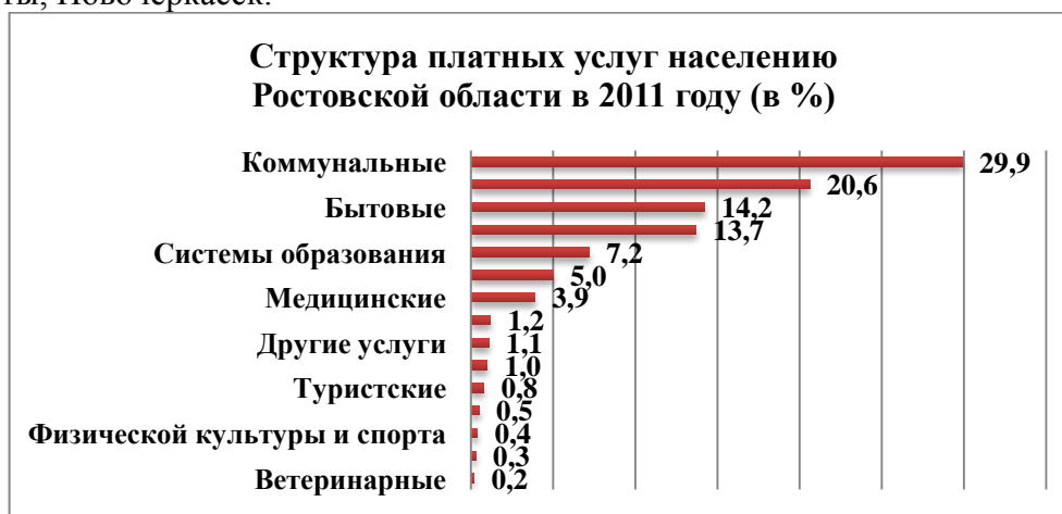
Рис. 1 - Структура платных услуг населению Ростовской области в 2011 году (в %)[1]

Сравнительно высокая численность (4 229 505 чел. в 2010 г.) и концентрация (42,38 чел. на км 2 ) населения в Ростовской области определяют рост платных услуг и предпосылки к расширению видов, оказываемых предприятиями сферы услуг (рисунок 1). Вместе с тем, потребительский рынок Ростовской области избирателен – это связано с территориальной концентрацией спроса на товары и услуги и близостью транспортной инфраструктуры в разрезе муниципальных образований. В Ростовской области эти условия наиболее благоприятны в пределах Ростовской агломерации и крупных городах – Таганрог, Шахты, Новочеркасск.