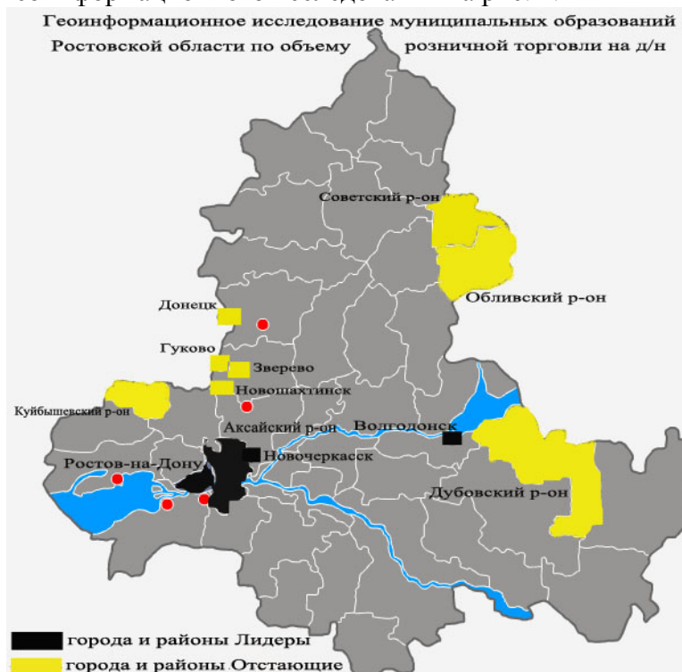
Рис. 4 – Геоинформационное исследование муниципальных образований Ростовской области по объему розничной торговли на душу населения

Для наглядности сложившейся ситуации на розничном рынке, представим вышеизложенное в виде геоинформационного исследования на рис. 4.