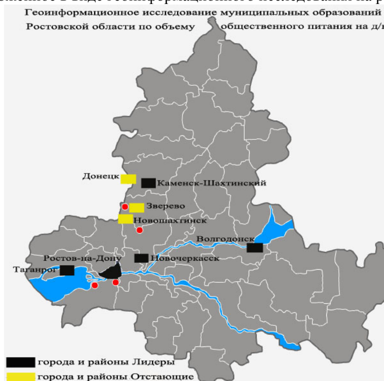
Рис. 5 – Геоинформационное исследование муниципальных образований Ростовской области по объему общественного питания на душу населения

Для наглядности сложившейся ситуации на рынке общественного питания, представим вышеизложенное в виде геоинформационного исследования на рис. 5.