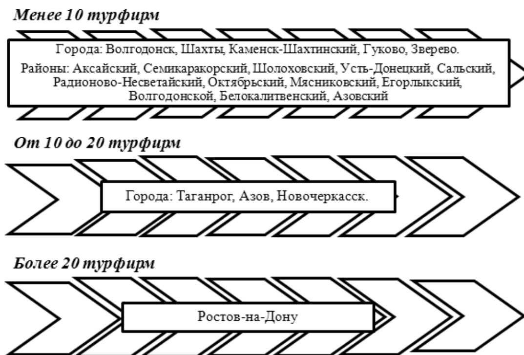
Рис. 3 – Дифференциация муниципальных образований Ростовской области по количеству турфирм

Образовательные услуги населению Ростовской области оказывают учреждения всех уровней: от начального до высшего (таблица 3).