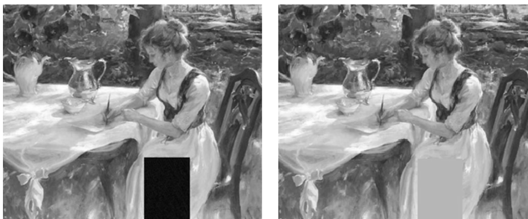
а) при заполнении шумов

Заполнение старших плоскостей влияет на результирующее изображение (рис 3, б) более выражено. Цвет закрашиваемой области становится схожим с окружающими цветами, но является ярче. Детали изображения на данной области полностью отсутствуют.