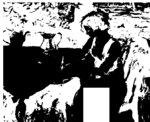
б) восьмая плоскость