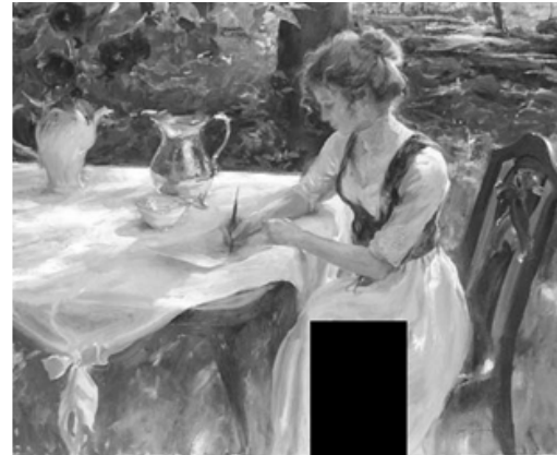
б) с закрашенной областью