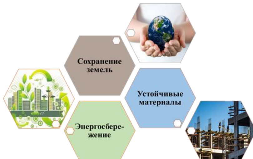
Рис. 1. – Содержание концепции устойчивости в строительной отрасли

микроуровне игнорируется. Как бы парадоксально это ни звучало, именно устойчивость на этом микроуровне осуществима и может в сумме внести колоссальные изменения, если принять целостный подход для улучшения процесса принятия решений [3,4].