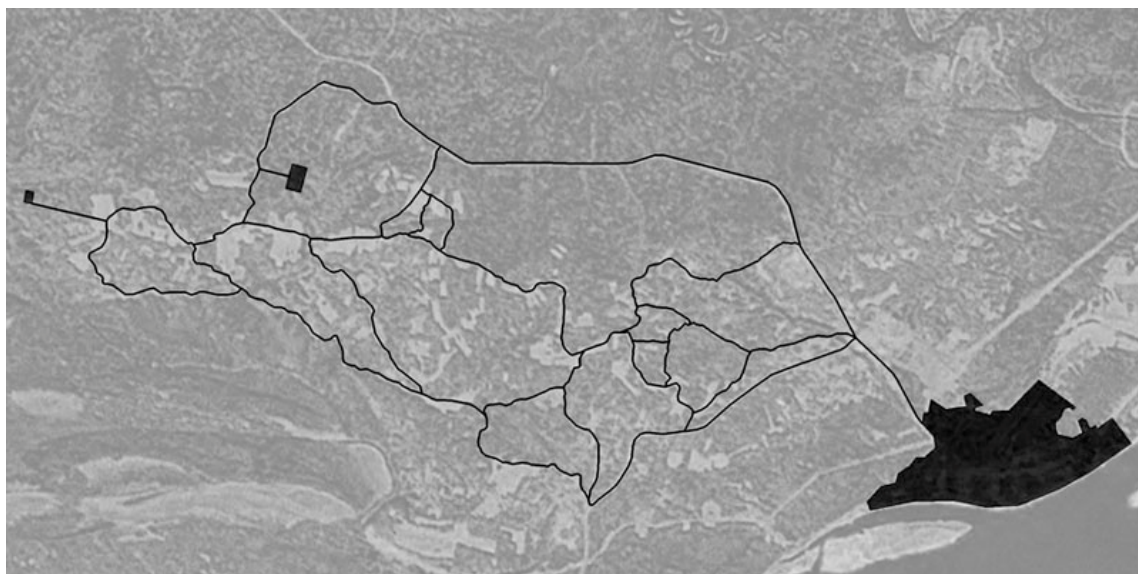
Рис. 1. - Карта с расположением лесосек, пункта назначения вывозки и сетью дорог

Возвращаясь к первому примеру, рассмотрим случай с двумя лесосеками, ниже обозначенные как пункты вывозки j=1 и j=3 , на которых хранится Q_1=187 \text{ м}^3 и Q_3=644 \text{ м}^3 лесоматериалов соответственно. В наличии у диспетчера имеется карта с расположением этих лесосек, пункта назначения вывозки и сетью дорог (рис. 1).